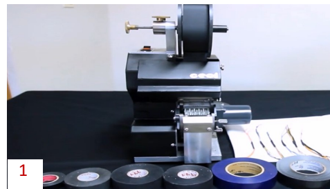
Varias cintas comerciales.